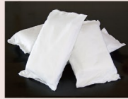
ドライアイス 一日分