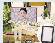
遺影写真 モニター映像&キャビネ版