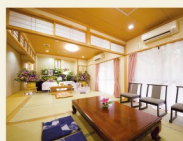
1Fフロア貸切 通夜・葬儀の会場使用料