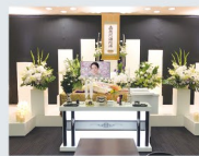
生花祭壇 シンプル