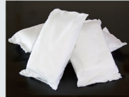
ドライアイス 一日分