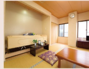
ご安置ルーム ご出棺までの会場使用料