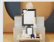
自宅後飾りセット