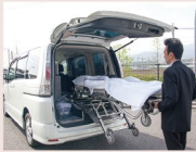
お迎え寝台車 10km以内・日中料金