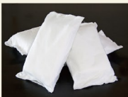
ドライアイス 一日分