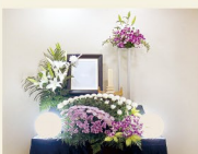
生花祭壇 シンプル