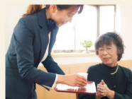
火葬場スタッフ 連絡・案内・接遇