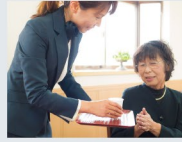
火葬場スタッフ 連絡・案内・接遇