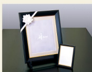
遺影写真 四つ切り&キャビネ版