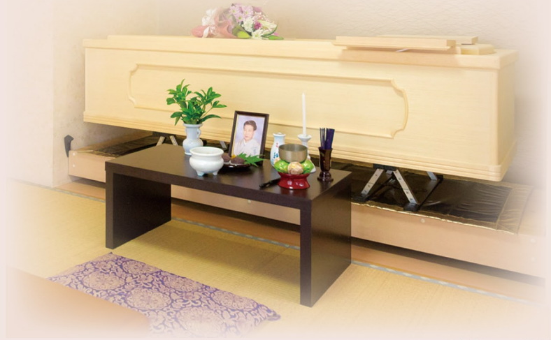
ご安置ルーム飾り例