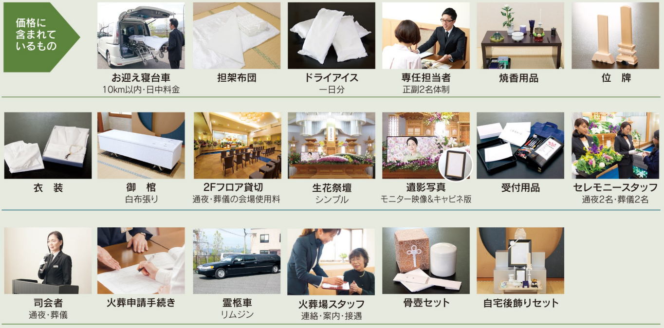
2Fメインホール飾り例