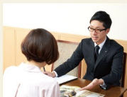
専任担当者 正副2名体制