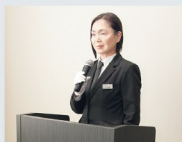
司会者 通夜・葬儀