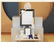
自宅後飾りセット