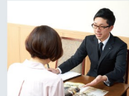
専任担当者 正副2名体制