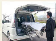
お迎え寝台車 10km以内・日中料金