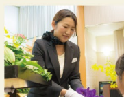
セレモニースタッフ 通夜1名・葬儀1名