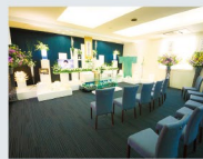
3Fフロア貸切 通夜・葬儀の会場使用料