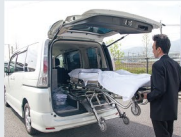
お迎え寝台車 10km以内・日中料金